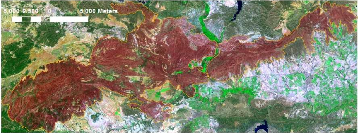
Imagen 1: Identificación de la superficie quemada en el año 1994 según imagen Landsat 5 TM, (RGB: 7;4;1)